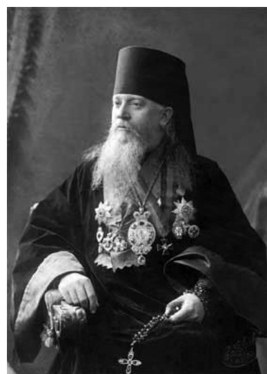
Епископ Тобольский и Сибирский Агафангел (Преображенский) (1854–1928) – организатор Тобольского отдела Императорского Православного Палестинского общества