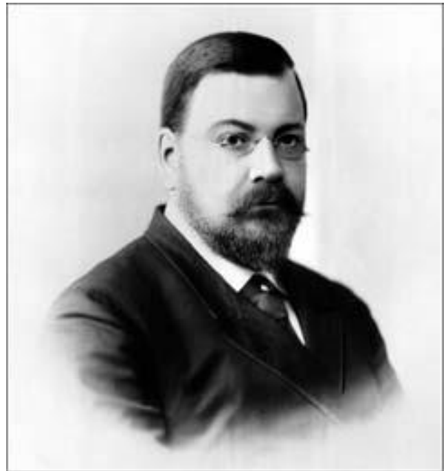
Николай Владимирович Султанов