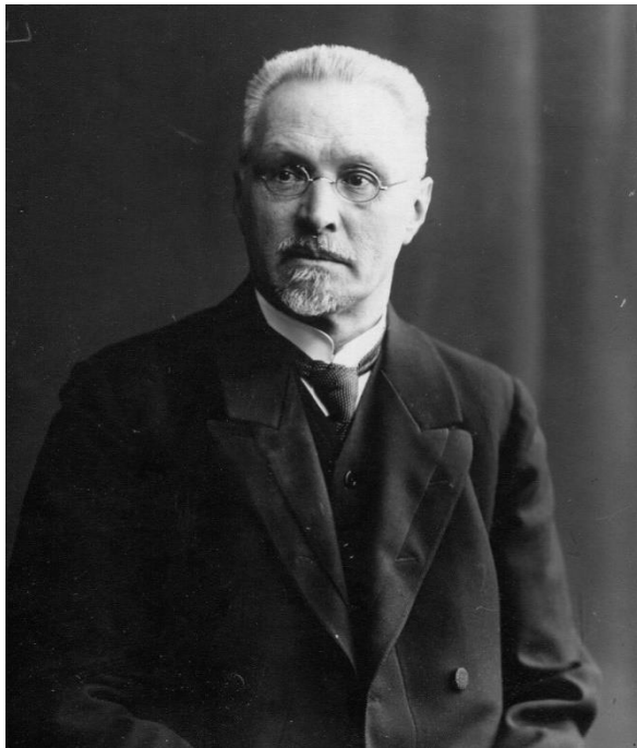
Сергей Федорович Платонов