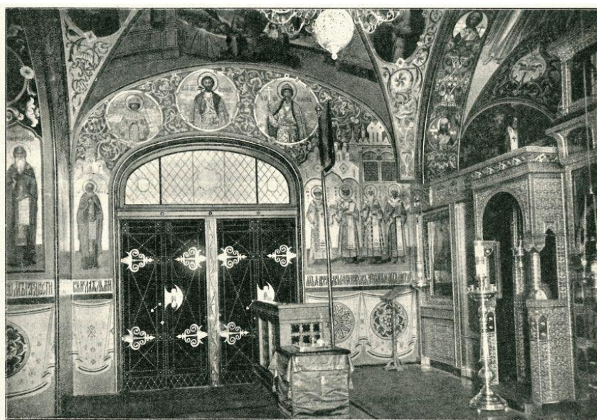
Внутренний вид церкви Педагогического института в С.-Петербурге. („Васменная“ работа в древне-русском стиле XVI—XVII вв. по проекту проф. Н. В. Султанова.—Къ стр. 772) (Собственная вытотипия „Русского Паломника“).

Источник: sobory.ru/article?object=11128