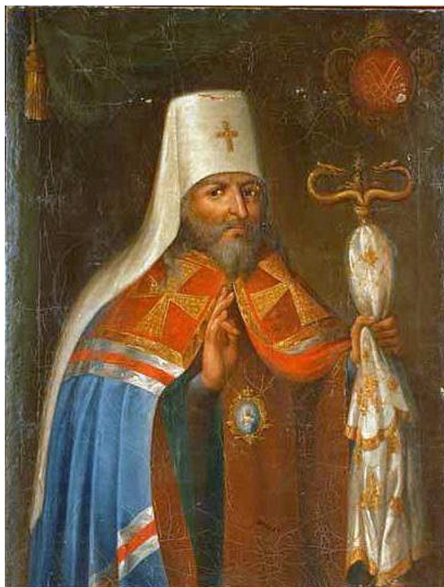
Павел Конносевичъ Писарьбашенный Антонидитя Тобольскій и Сибирскій, примыкала пошекинанию къ Лаврѣ 1768 года августа 20. преставился 1770 года Нолва 14. погребенъ того го года Декабря 19 дня въ некропечеркѣ Лавры архимандритомъ Зосимомъ.

Contact information: 628605, Tyumen region, Khanty-Mansiysk Autonomous Area — Yugra, 56 Lenina Street, tel. (3466) 273510, e-mail: roshist@mail.ru.