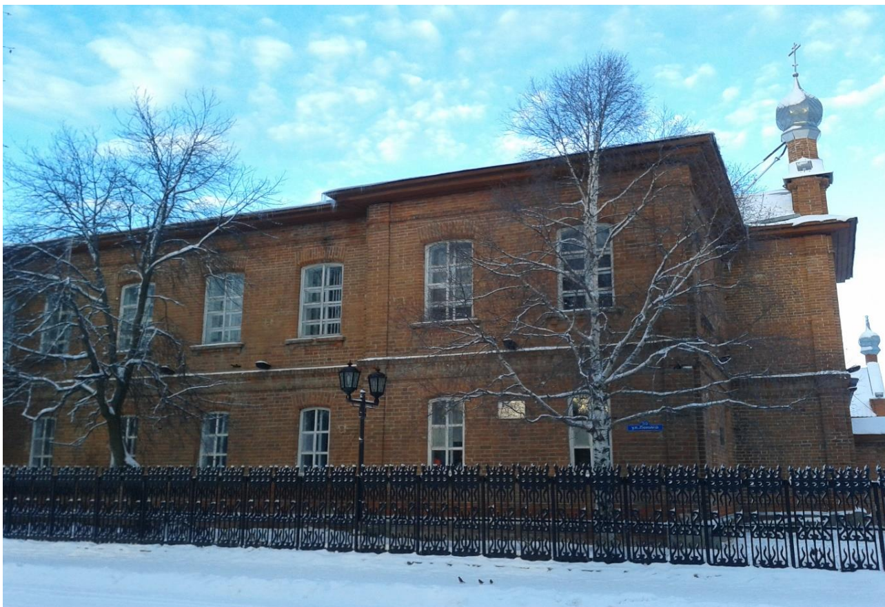
Здание второклассной учительской школы (р.п. Березово). Современное фото