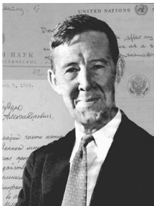
Питирим Александрович Сорокин (1889–1968)