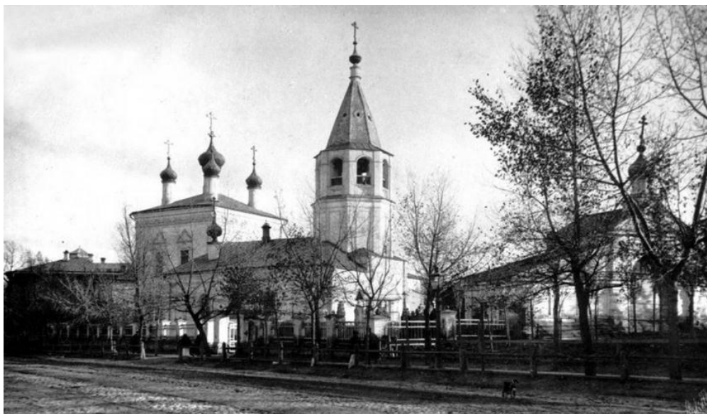
Рис. 1. Спасо-Преображенская единоверческая церковь на Горянской площади (1902 г.)