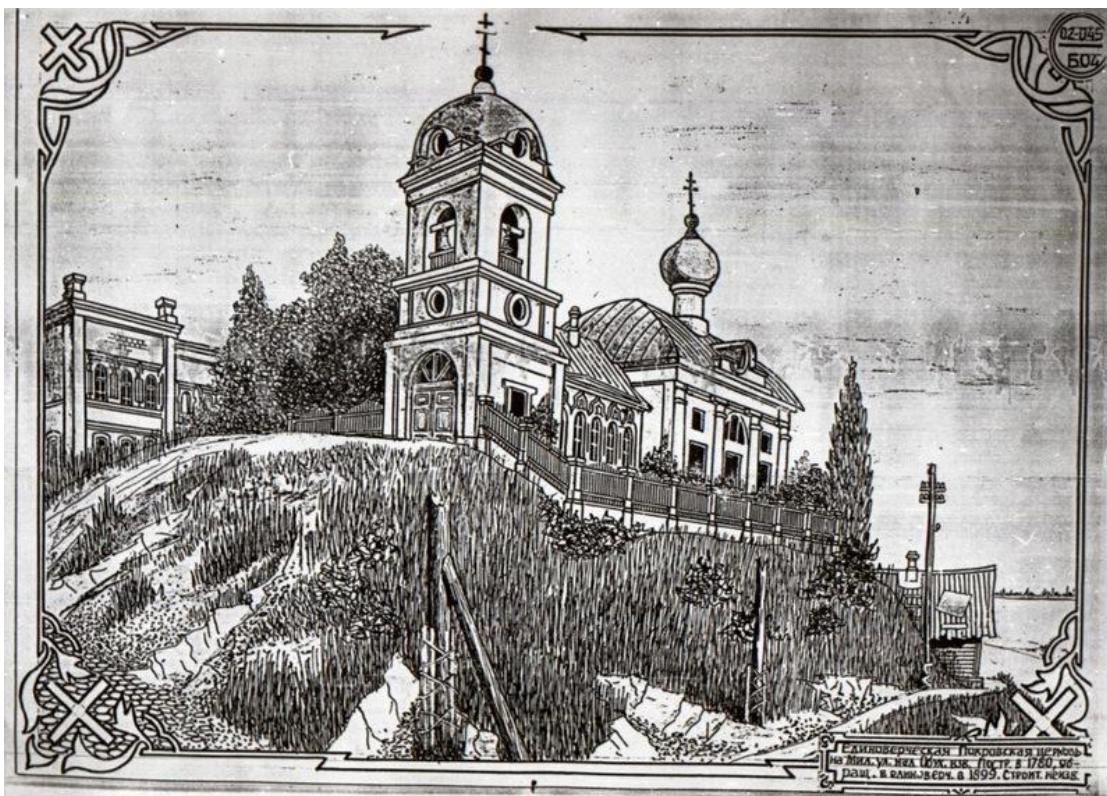
Рис. 2. Покровская единоверческая церковь на Обуховском взвозе Рисунок Б.М. Мозера (вторая половина XIX в.)