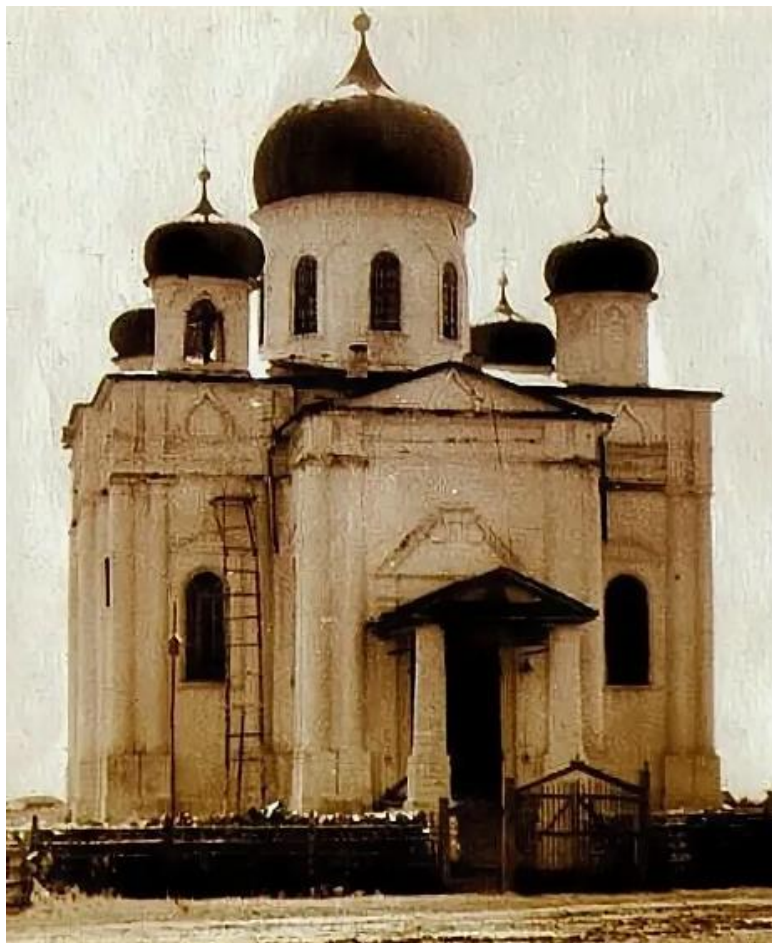
Рис. 2. Храм Вознесения Господня. Автор и год снимка неизвестен. ( https://sobory.ru/photo/387175 )